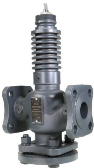
Рис. 1 - Внешний вид клапана регулирующего VFS-2R

VFS-2R – клапан регулирующий, седельный, фланцевый, с разгрузкой по давлению (для DN65-200), предназначен для применения без адаптера с электроприводами: